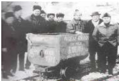
Posledný vagón s rudou vyvezený z bane