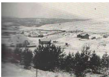
Areál manganorudných baní v Kišovciach