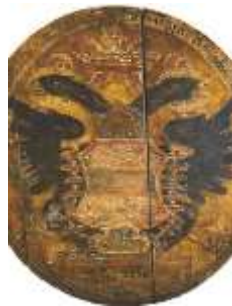
Vývesný štít pošty v Hôrke

Vo Svätom Ondreji v rokoch 1850- 1854 mal sídlo a fungoval okresný súd. V 13. storočí tu bol postavený kostol, ktorý bol v 18. storočí prestavaný. Obec preslávili aj minerálne pramene, ktoré vplyvom banskej činnosti sa skoro všetky v 50. rokoch stratili.