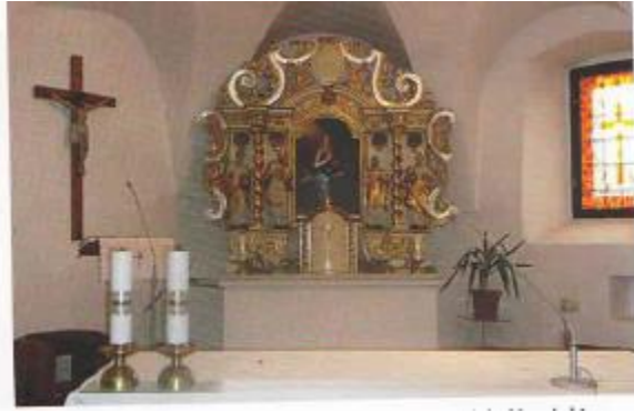
Kostol rímsko–katolícky ranogotický z polovice 13. Storočia