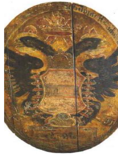
Vývesný štít pošty v Hôrke

Vo Svätom Ondreji v rokoch 1850- 1854 mal sídlo a fungoval okresný súd. V 13. storočí tu bol postavený kostol, ktorý bol v 18. storočí prestavaný. Obec preslávili aj minerálne pramene, ktoré vplyvom banskej činnosti sa skoro všetky v 50. rokoch stratili.