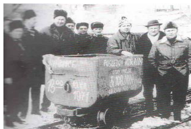
Posledný vagón s rudou vyvezený z bane