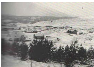
Areál manganorudných baní v Kišovciach

Mangánová ruda ako strategická surovina pre výrobu ocelí začala byť vyhľadávaná v druhej polovici 19. Storočia, v období industriálnej revolúcie v Uhorsku. V roku 1939 sa zvýšila ťažba mangánovej rudy, čo malo za následok príliv prisťahovalcov za prácou nielen z rôznych častí Slovenska, ale aj Maďarska, Poľská i Rumunska. Na začiatku 20. Storočia sa vyčerpala povrchovo dobývateľná časť ložísk a prešlo sa na otváranie hlbinných častí. To si vyžadovalo investičné prostriedky a modernejšie technické vybavenie bane. Vítkovicke banské a hutné ťažiarstvo Kotterbachy vystavali banský závod s bytovou kolóniou a lanovkou ku železnici v Kišovciach. Banská a hutná spoločnosť zasa postavila vlastný závod vo Švábociach. V roku 1941 – 1945 bane získala Ruda, uč. Spol. Koterbachy. V roku 1945 bola tunajšia baňa znárodnená a stala sa závodom Železorudných baní Spišská Nová Ves. Ťažba bola ukončená 1. apríla 1971 z ekonomických dôvodov.