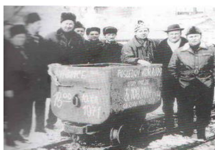
Posledný vagón s rudou vyvezený z bane