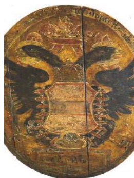
Vývesný štít pošty v Hôrke

Vo Svätom Ondreji v rokoch 1850- 1854 mal sídlo a fungoval okresný súd. V 13. storočí tu bol postavený kostol, ktorý bol v 18. storočí prestavaný. Obec preslávili aj minerálne pramene, ktoré vplyvom banskej činnosti sa skoro všetky v 50. rokoch stratili.