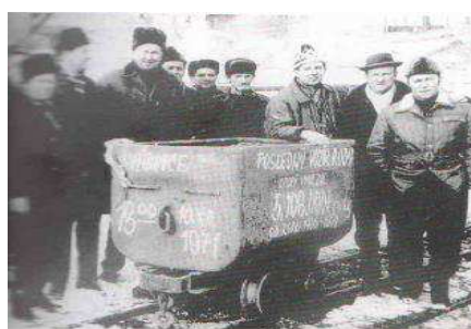
Posledný vagón s rudou vyvezený z bane