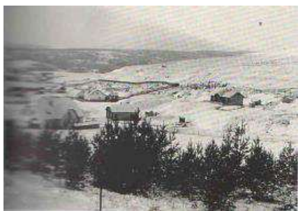
Areál manganorudných baní v Kišovciach

Mangánová ruda ako strategická surovina pre výrobu ocelí začala byť vyhľadávaná v druhej polovici 19. Storočia, v období industriálnej revolúcie v Uhorsku. V roku 1939 sa zvýšila ťažba mangánovej rudy, čo malo za následok príliv prisťahovalcov za prácou nielen z rôznych častí Slovenska, ale aj Maďarska, Poľská i Rumunska. Na začiatku 20. Storočia sa vyčerpala povrchovo dobývateľná časť ložísk a prešlo sa na otváranie hlbinných častí. To si vyžadovalo investičné prostriedky a modernejšie technické vybavenie bane. Vítkovicke banské a hutné ťažiarstvo Koterbachy vystavali banský závod s bytovou kolóniou a lanovkou ku železnici v Kišovciach. Banská a hutná spoločnosť zasa postavila vlastný závod vo Švábociach. V roku 1941 – 1945 bane získala Ruda, uč. Spol. Koterbachy. V roku 1945 bola tunajšia baňa znárodnená a stala sa závodom Železorudných baní Spišská Nová Ves. Ťažba bola ukončená 1. apríla 1971 z ekonomických dôvodov.